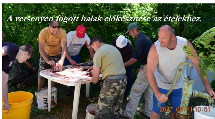
A versenyen fogott halak előkészítése az ételekhez.